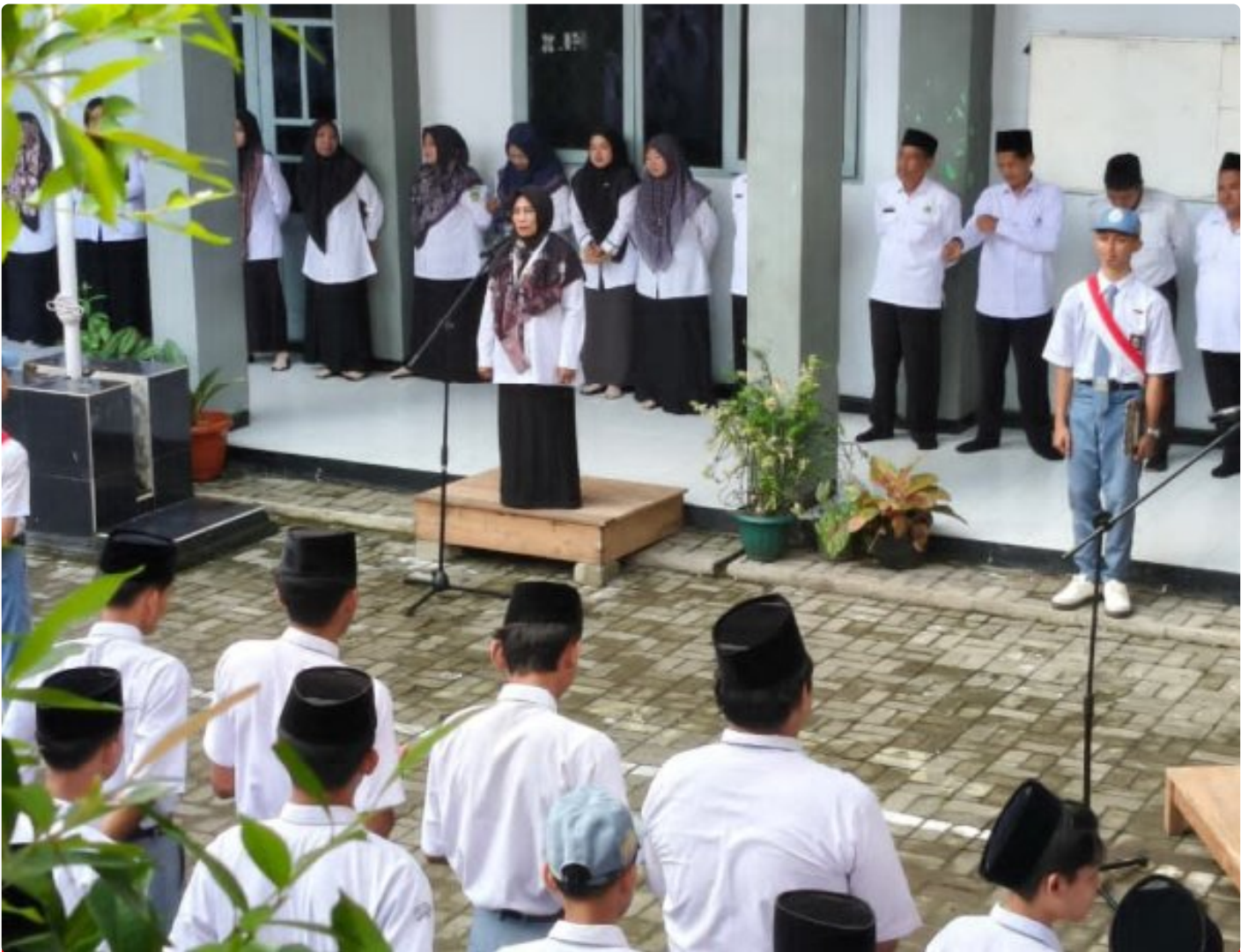
Pengawas Madrasah Teguhkan Karakter Emas Siswa MA Al Falah Jatilawang

BANYUMAS - MA Al Falah Jatilawang, Kabupaten Banyumas, Jawa Tengah, menggelar upacara bendera dengan khidmat di halaman madrasah, pada Senin (19/01/2026).