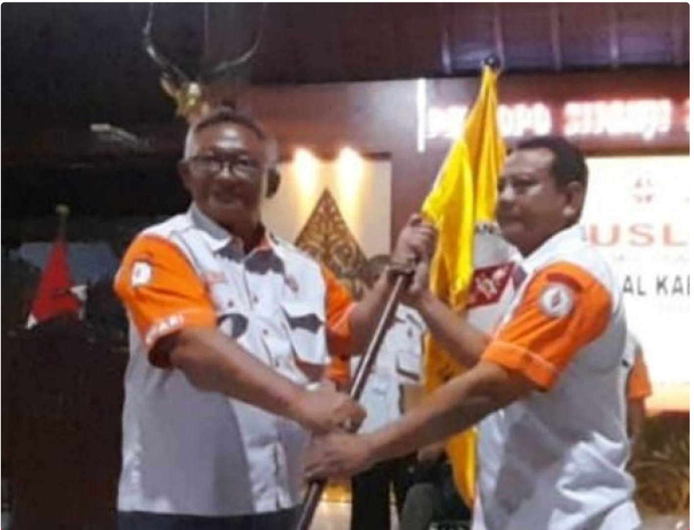
Muslok XVI ORARI Banyumas berlangsung Lancar dan Demokratis

BANYUMAS - Musyawarah Lokal (Muslok) XVI Organisasi Amatir Radio Indonesia (ORARI) Lokal Kabupaten Banyumas Tahun 2025 berlangsung lancar, demokratis, dan penuh semangat kebersamaan. Kegiatan tersebut digelar di Pendopo Sipanji Purwokerto, Minggu (21/12/2025),