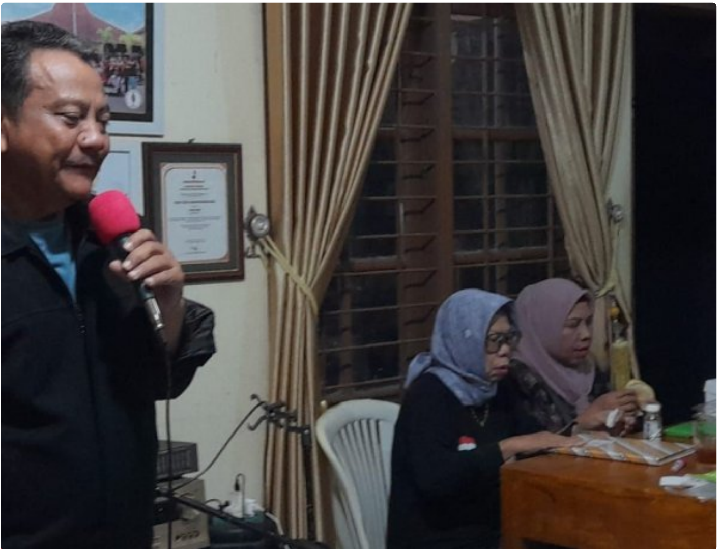
Merawat Frekuensi Persaudaraan, ORARI Banyumas Perkuat Silaturrahi Lewat Arisan Rutin

BANYUMAS - Semangat kebersamaan dan persaudaraan kembali mengalir hangat dalam Kegiatan Silaturrahi dan Arisan Rutin Anggota ORARI Lokal Kabupaten Banyumas, Jawa Tengah yang digelar pada Minggu malam (28/12/2025) di Sekretariat ORARI Lokal Kabupaten Banyumas.