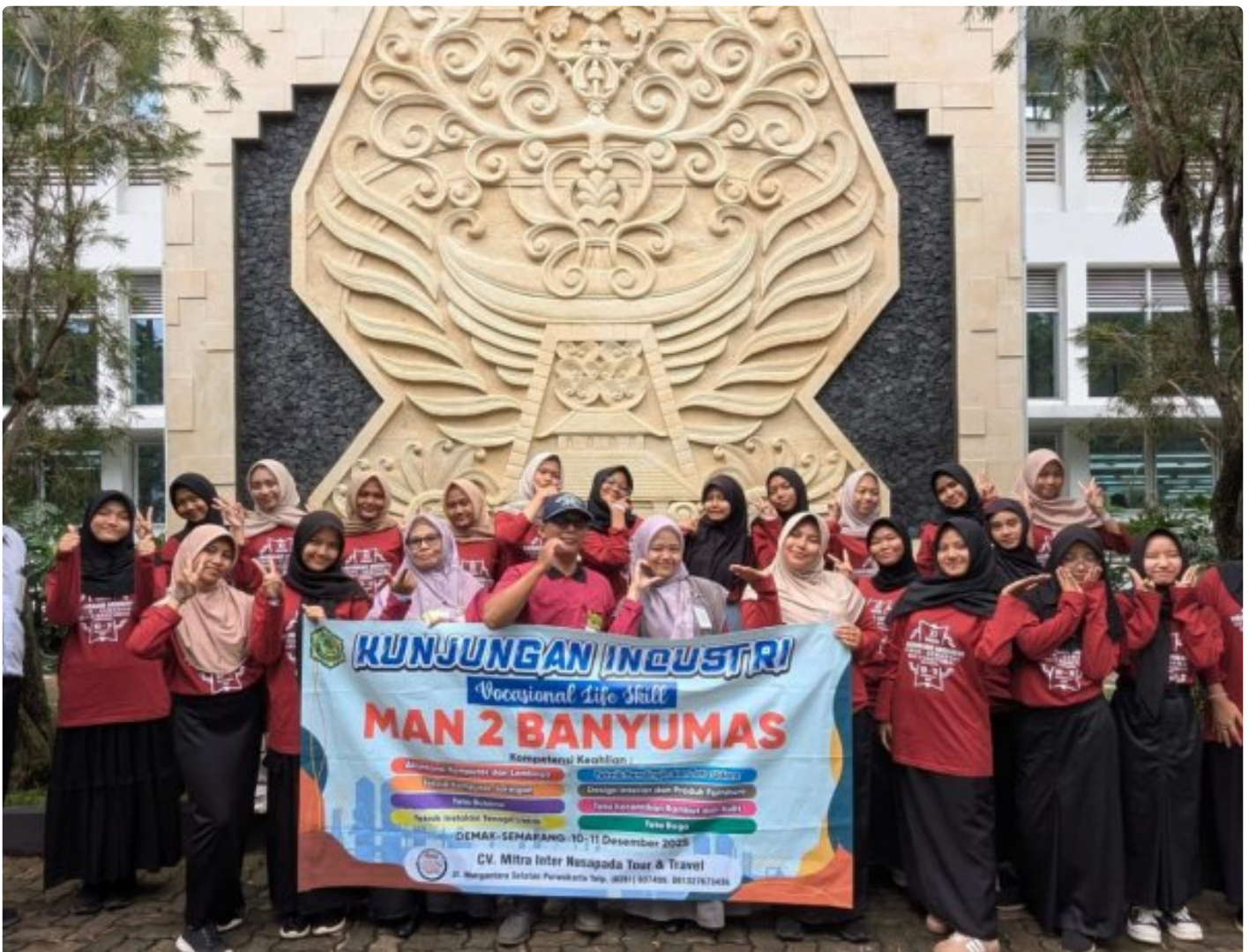
MAN 2 Banyumas Kirim 175 Siswa Vokasi ke Semarang, Kunjungan Industri dan MoU Strategis

Banyumas - Dalam ikhtiar memadukan ilmu dan amal, MAN 2 Banyumas memberangkatkan 175 siswa Kelas XI Program Vokasi untuk mengikuti Kunjungan Industri (KI) ke Semarang, 10–11 Desember 2025.