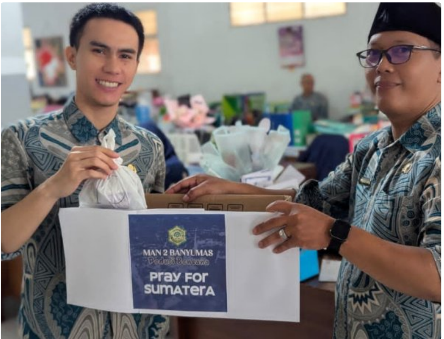
MAN 2 Banyumas Hadirkan Empati, Ringankan Derita Korban Banjir Sumatera

Banyumas - Di tengah denyut aktivitas pendidikan yang terus berjalan, MAN 2 Banyumas kembali menunjukkan bahwa karakter mulia tidak hanya dibangun di ruang kelas, tetapi juga melalui kepedulian nyata. Pada Kamis (04/12/2025),