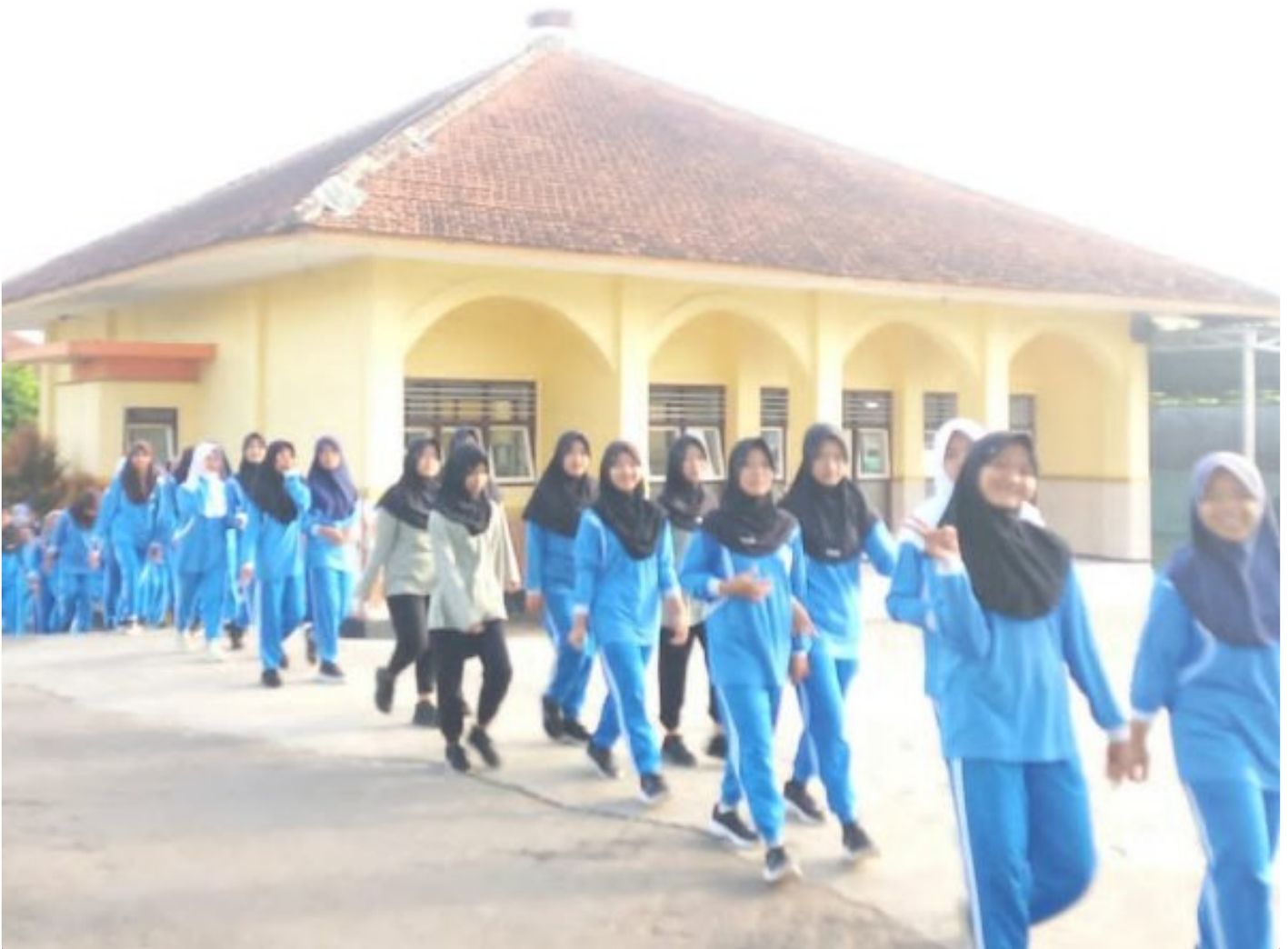
Langkah Pagi Penuh Berkah, MTsN 1 Banyumas Gemakan Jalan Sehat Bangkitkan Jiwa dan Raga

Banyumas - Suasana pagi di MTsN 1 Banyumas bergelora oleh langkah kebersamaan saat madrasah ini menggelar jalan sehat pada Jumat, 9 Januari 2026, pukul 07.00 WIB.