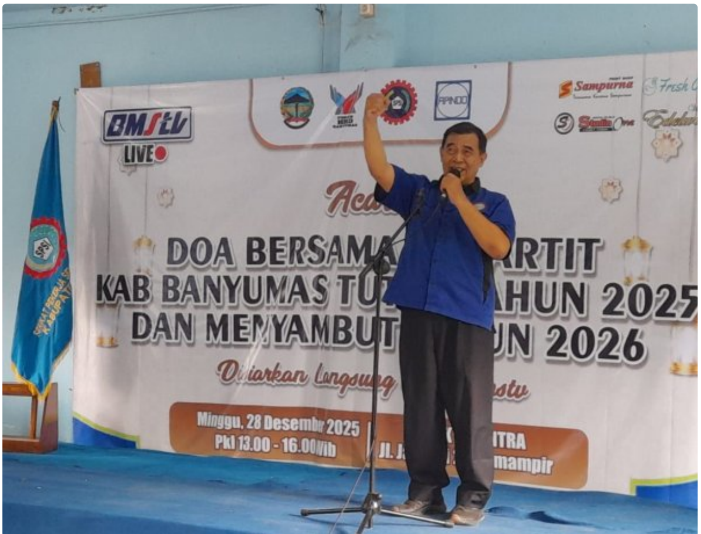
Doa Bersama KSPSI Banyumas Tutup 2025, Refleksi Perjuangan Menggema Sambut 2026

BANYUMAS - Dewan Pimpinan Cabang Konfederasi Serikat Pekerja Seluruh Indonesia (DPC KSPSI) Kabupaten Banyumas menggelar Doa Bersama Tahun 2026 dan Refleksi Perjuangan Tahun 2025, Minggu (28/12/2025), di SMK TI Bintra, Sumampir, Purwokerto, Banyumas.